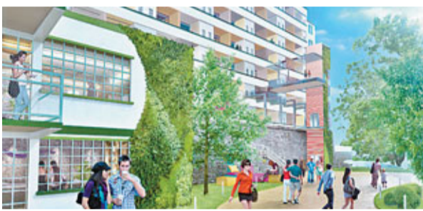
公眾休憩空間效果圖

政府在2009年推出「保育中環」計劃，其中建成於1939年的、包浩斯建築風格代表的中環街市，被作為重點保育項目加以活化。構思中的「漂浮綠洲」概念，主要以大量綠化空間設計，豐富未來的多功能文娛項目，並帶動周邊相鄰的街道，成為新市集。