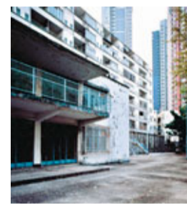
少年警訊會所樓外操場

一直以來，香港提供創意設計的展示和營商空間嚴重不足，目前較有代表性的地方，如石硤尾賽馬會創意中心、沙田伏炭藝術村、香港設計中心等，許多都是利用閒置的工廠大廈轉化為藝術家工作室。至於創意的終端——產品陳列及銷售環節並不是它們側重的地方。擬建中的PMQ，則試圖彌補此方面的不足。