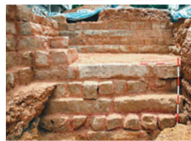
前中央書院地基建跡