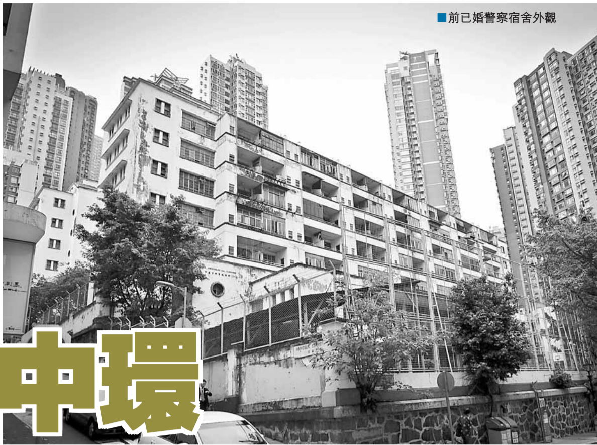
前已婚警察宿舍外觀